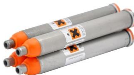
4-ranný OC zásobník pro JPX4