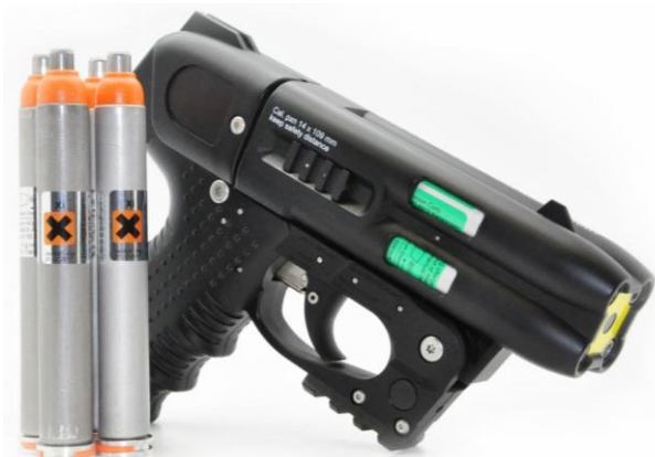
JPX4 Jet Defender Law Enforcement s OC zásobníkem

V nabídce jsou dvě verze JPX4- Compact a Law Enforcement , který má navíc prodlouženou rukojeť, laserový značkováč a Picatinny rail pro přidání taktické svítilny.