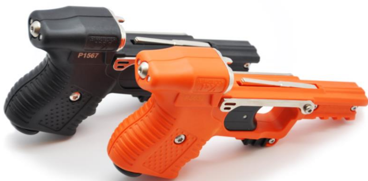
Rám JPX je dostupný ve dvou barevných variantách- černá a oranžová

Výměny zásobníku docílíme jednoduchým odjištěním oboustranné páčky směrem dolů a vysunutí zásobníku z vodící lišty.