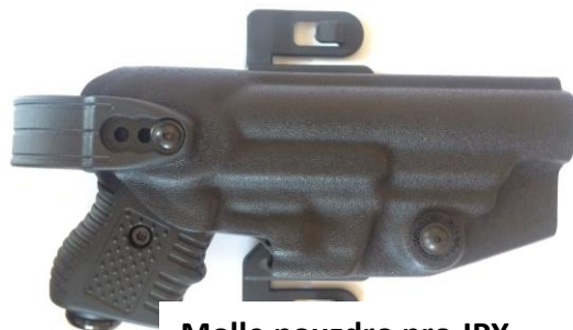
Molle pouzdro pro JPX