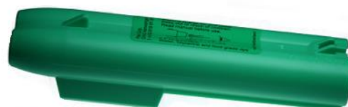
Zásobníky JPX- OC a tréninkový