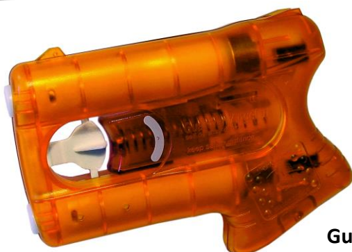
Guardian Angel II tréninková verze