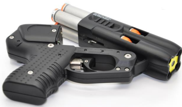
JPX4 Jet Defender Compact