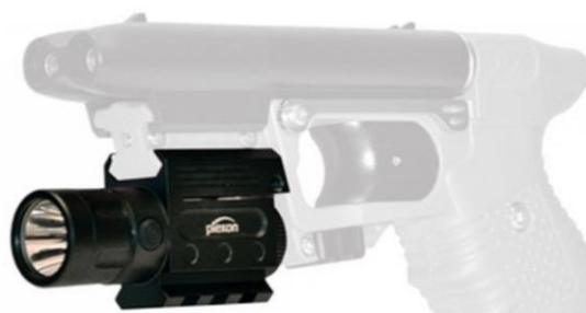
Taktická svítilna se stroboskopem