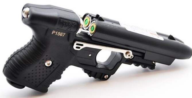
Odjišťovací mechanismus zásobníku