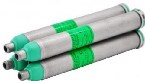
Tréninkový zásobník JPX4