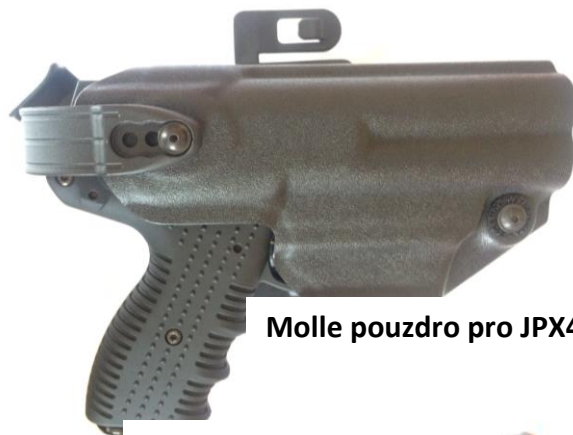
Molle pouzdro pro JPX4