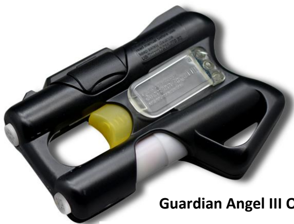
Guardian Angel III OC

Po prolomení bezpečnostní pojistky a po stisknutí spouště se jako první iniciuje horní nábojka a hned za „výstřelem“ se spínač přepínacího mechanismu přepne na dolní nábojku a zařízení je připraveno pro druhý "výstřel".