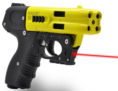
JPX4 Jet Defender Law Enforcement, žlutý